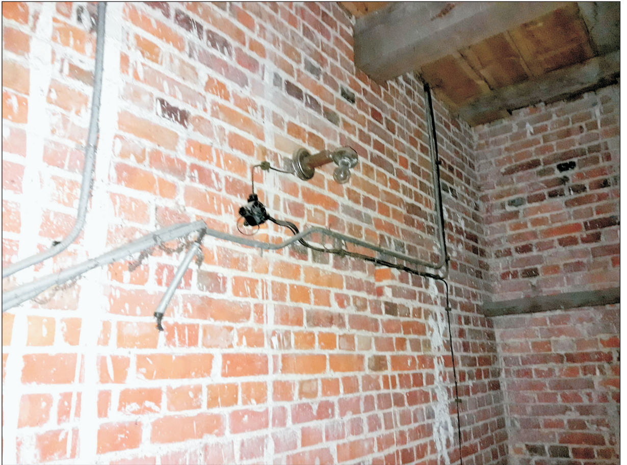
INSTALACJA ELEKTR. W POMIESZCZENIU NAD ZAKRYSTIĄ.