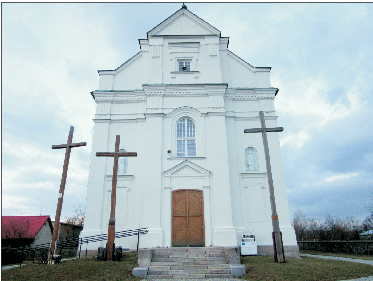
WIDOK ELEWACJI FRONTOWEJ - STRONA POŁUDNIOWA.