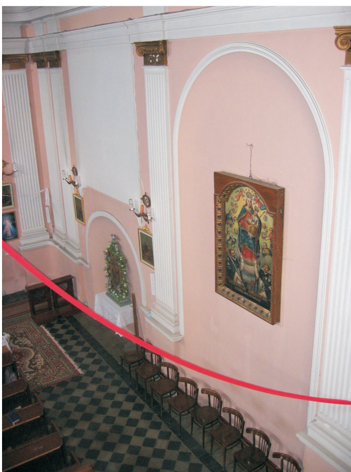
WIDOK FRAGMENTU ŚCIANY - STRONA PRAWA.