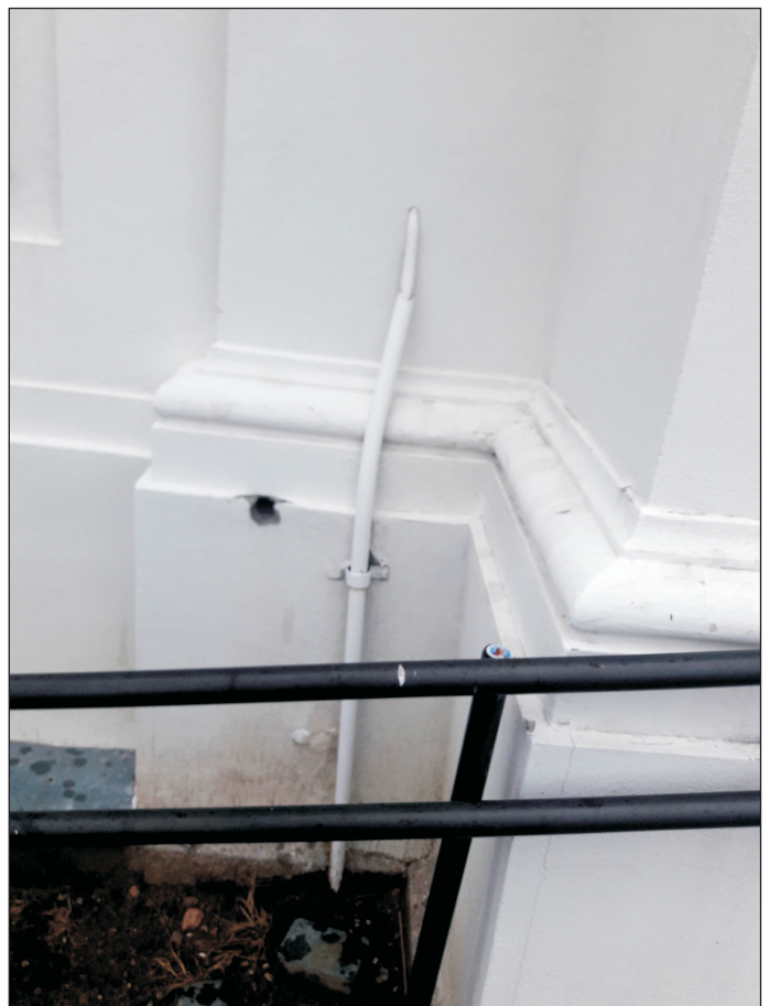
WIDOK WEJŚCIA KABLA ELEKTRYCZNEGO PO LEWEJ STRONIE WEJŚCIA DO KOŚCIOŁA.