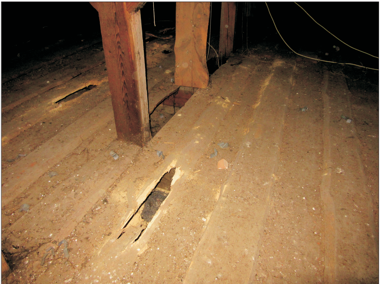
STAN PODŁOGI NA PODDASZU SKORODOWANEJ PRZEZ OWADY.