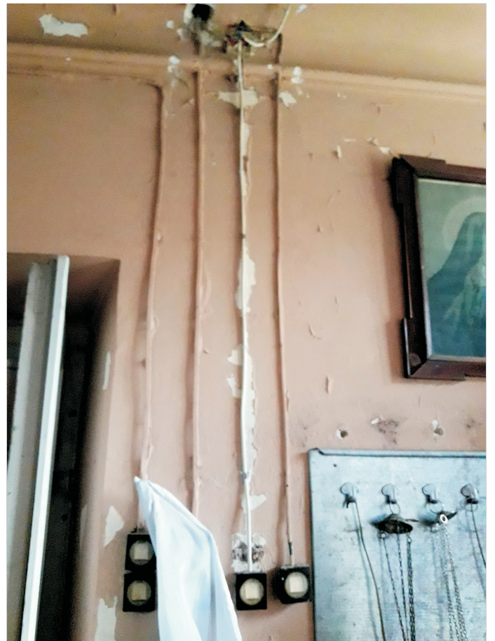
INSTALACJA ELEKTR. W POMIESZCZENIU ZAKRYSTII.