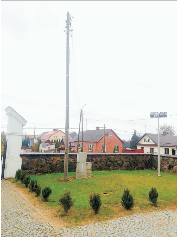
WIDOK ZŁĄCZA KABLOWEGO I SZAFEK ELEKTRYCZNYCH PRZY BRAMIE GŁÓWNEJ.