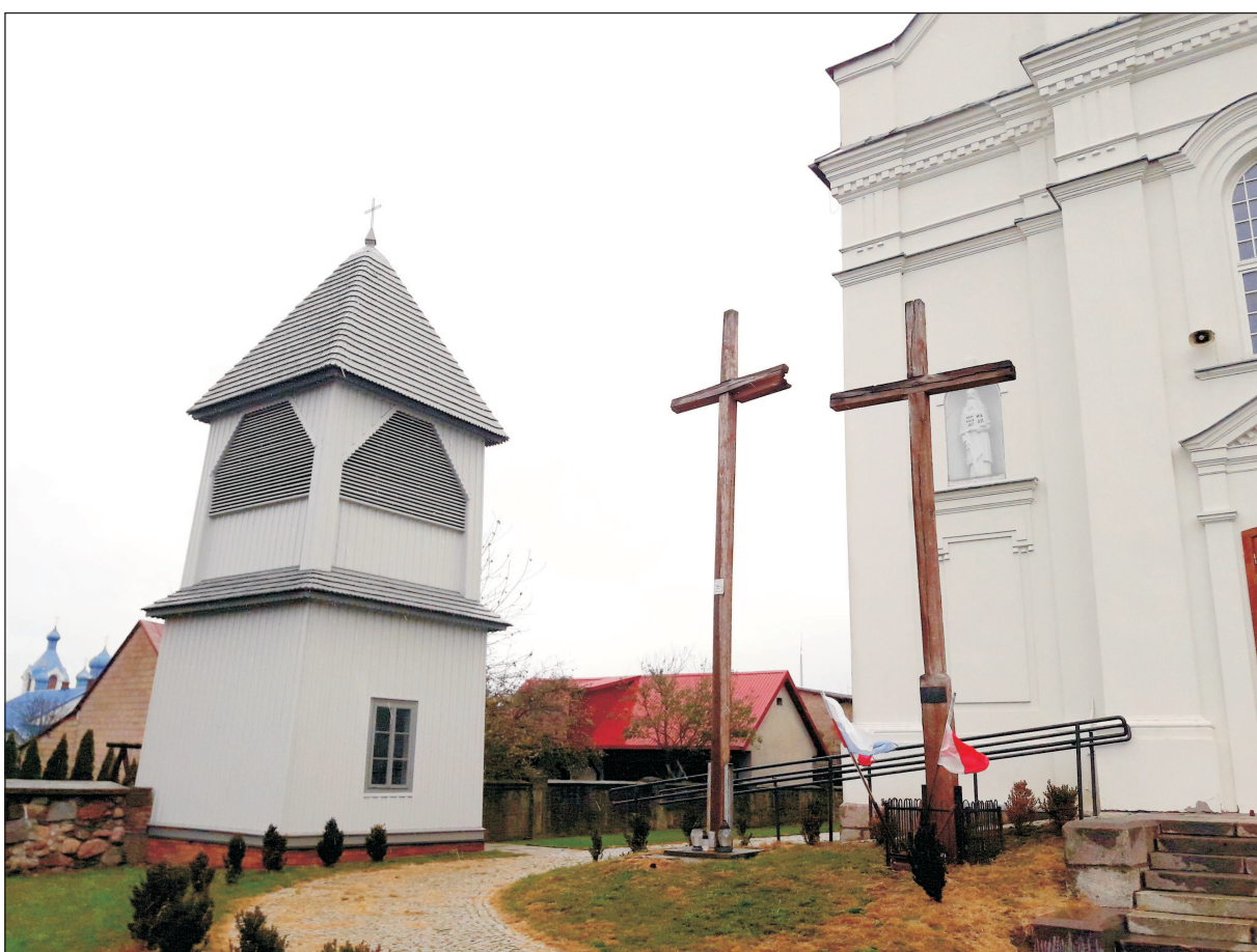
WIDOK DZWONNICY OD STRONY PŁD. - WSCH.