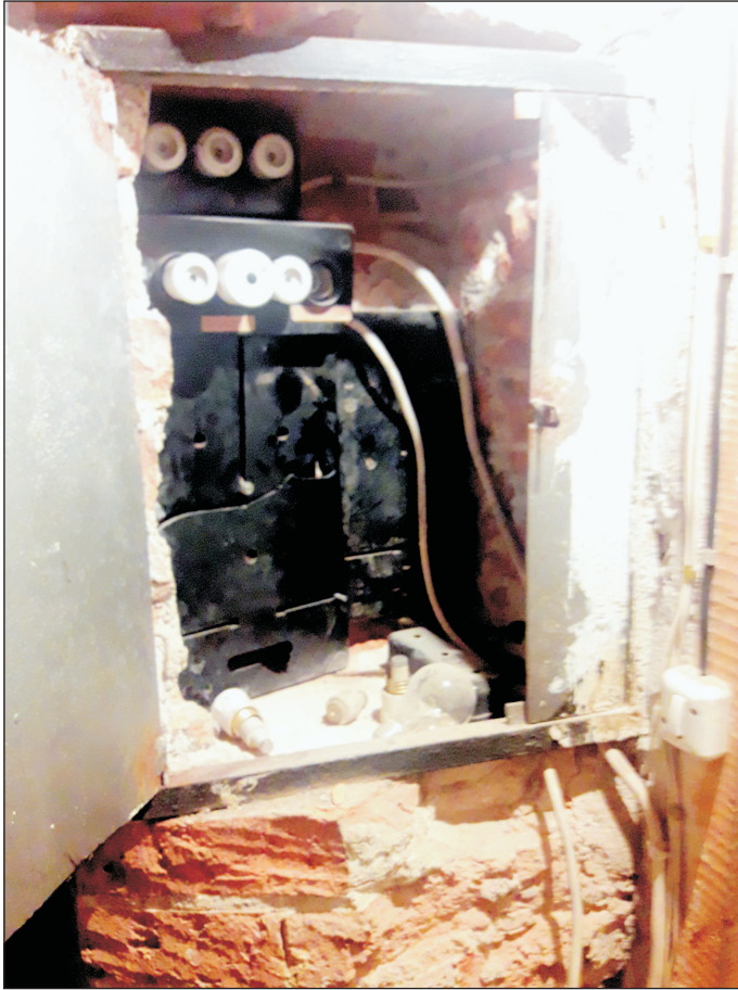
BEZPIECZNIKI I INSTALACJA ELEKTR. W POM. BYŁEJ KOTŁOWNI.