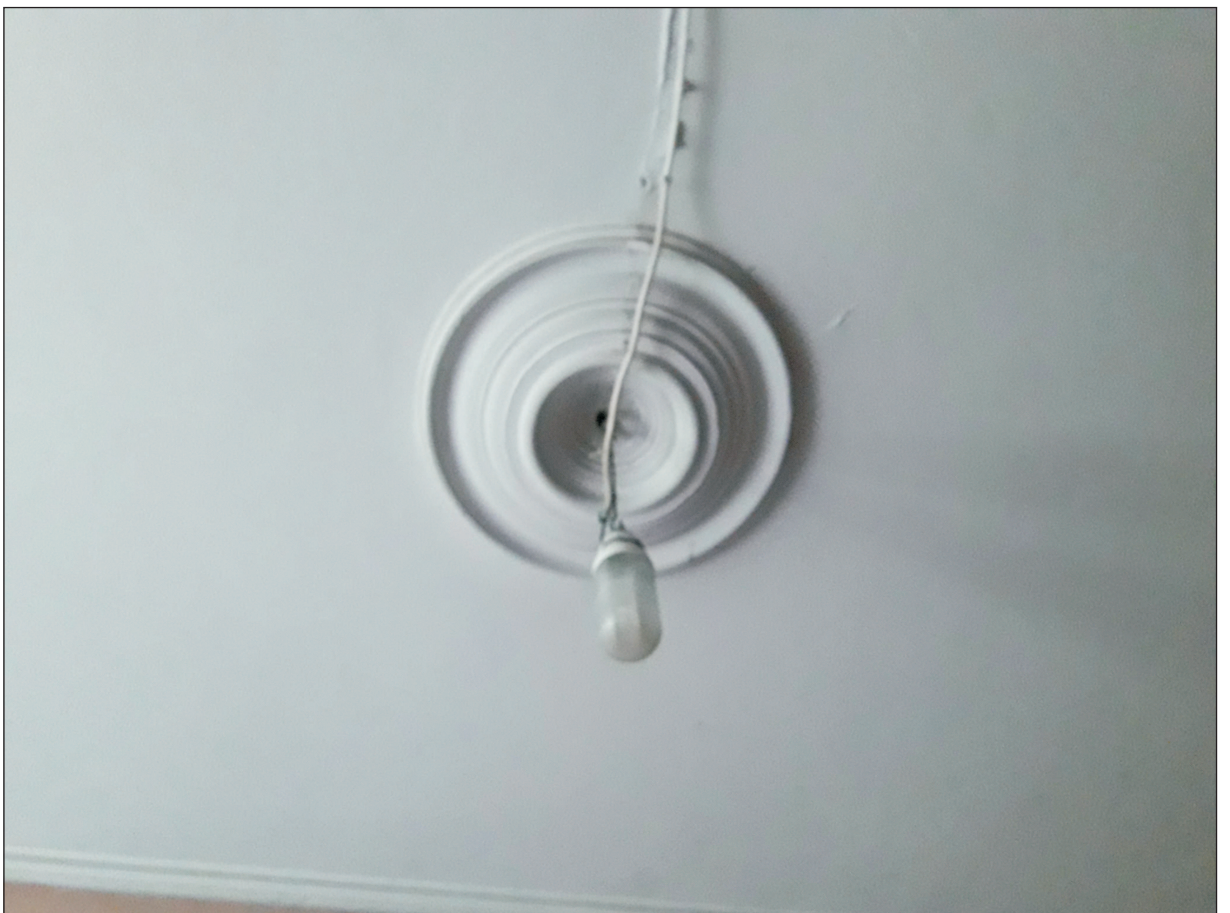
INSTALACJA ELEKTR. OŚWIETLENIOWA W POMIESZCZENIU ZAKRYSTII - STRONA PRAWA.