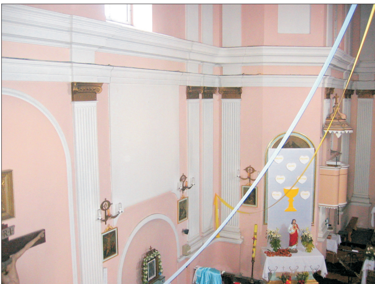
WIDOK OŁTARZA BOCZNEGO - STRONA LEWA.