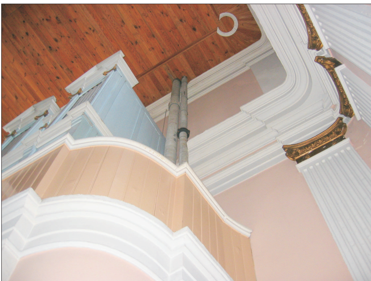
WIDOK FRAGMENTU EMPORY ORGANOWEJ.