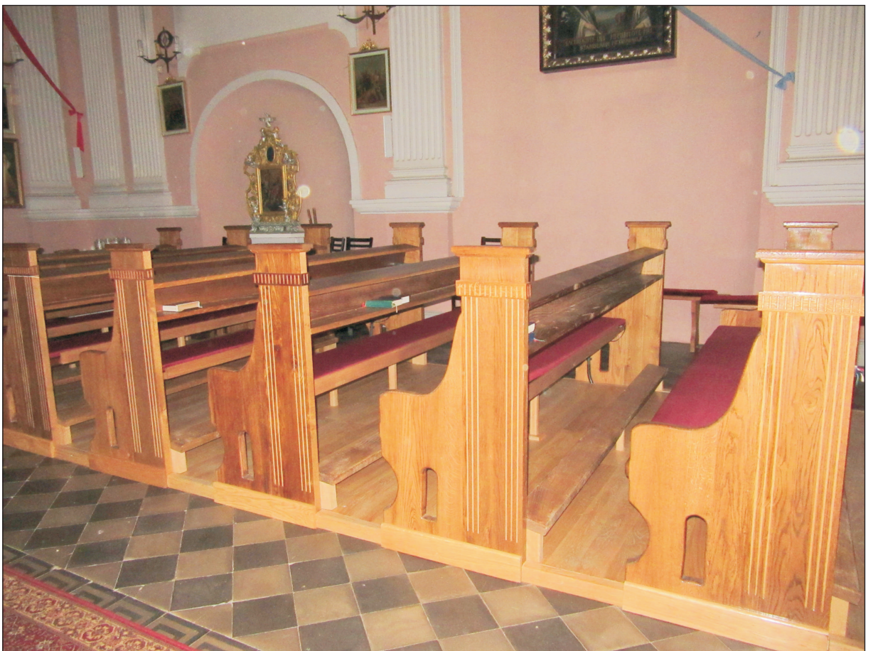
WIDOK ŁAWEK KOŚCIELNYCH.