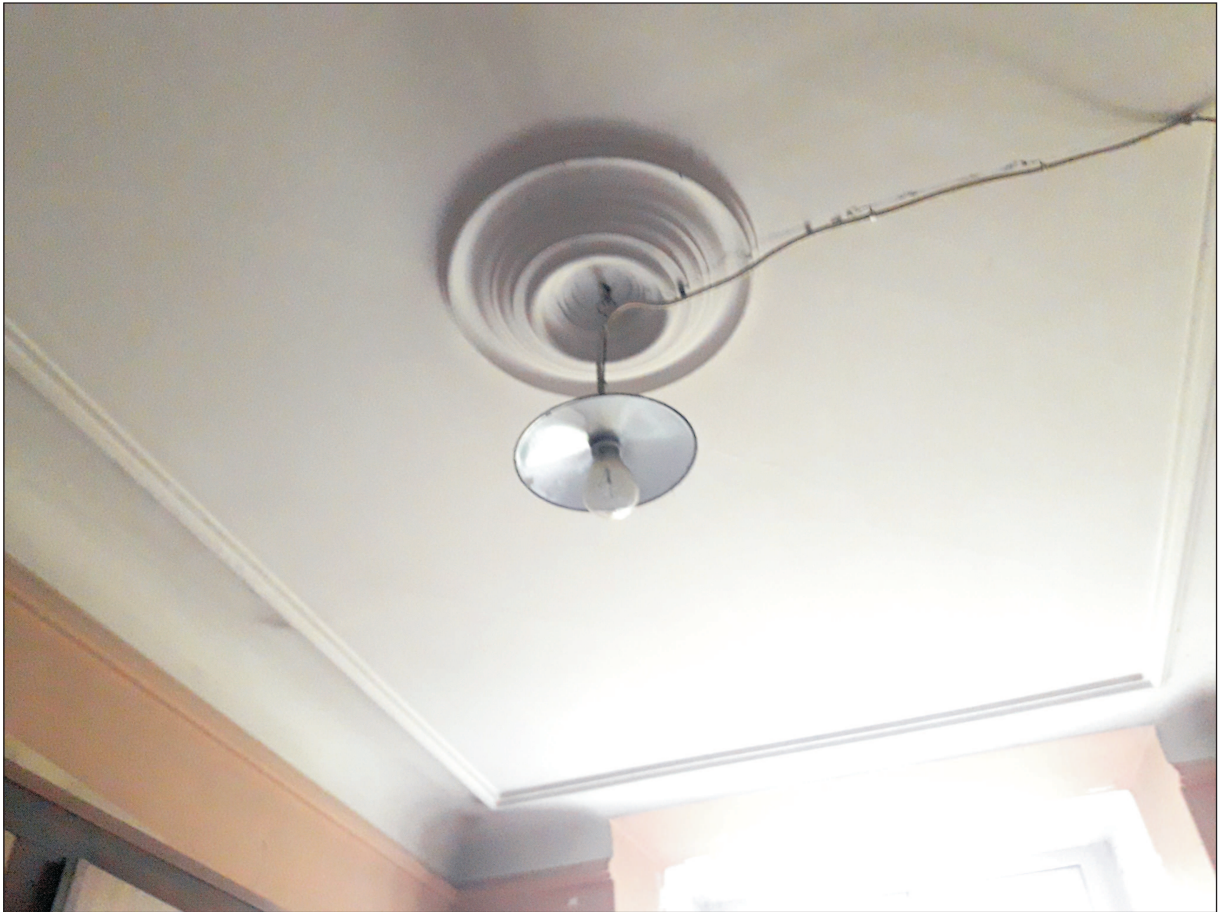
INSTALACJA ELEKTR. OŚWIETLENIOWA W POMIESZCZENIU ZAKRYSTII - STRONA LEWA.