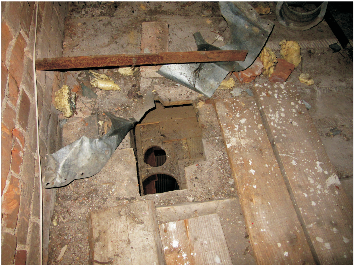
WIDOK OTWORÓW PO RURACH SPALINOWYCH BYŁEGO KOTŁA OLEJOWEGO.