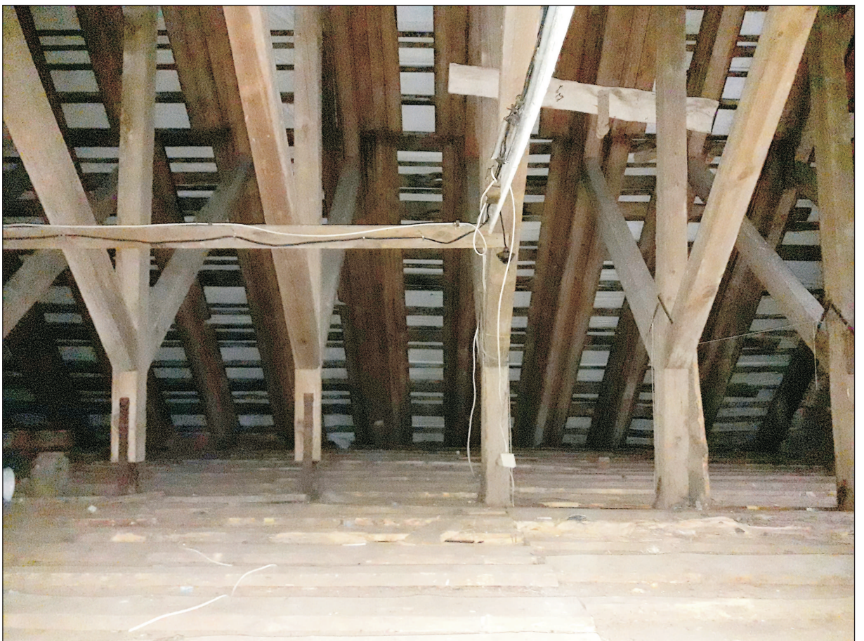
INSTALACJA ELEKTRYCZNA NA PODDASZU.