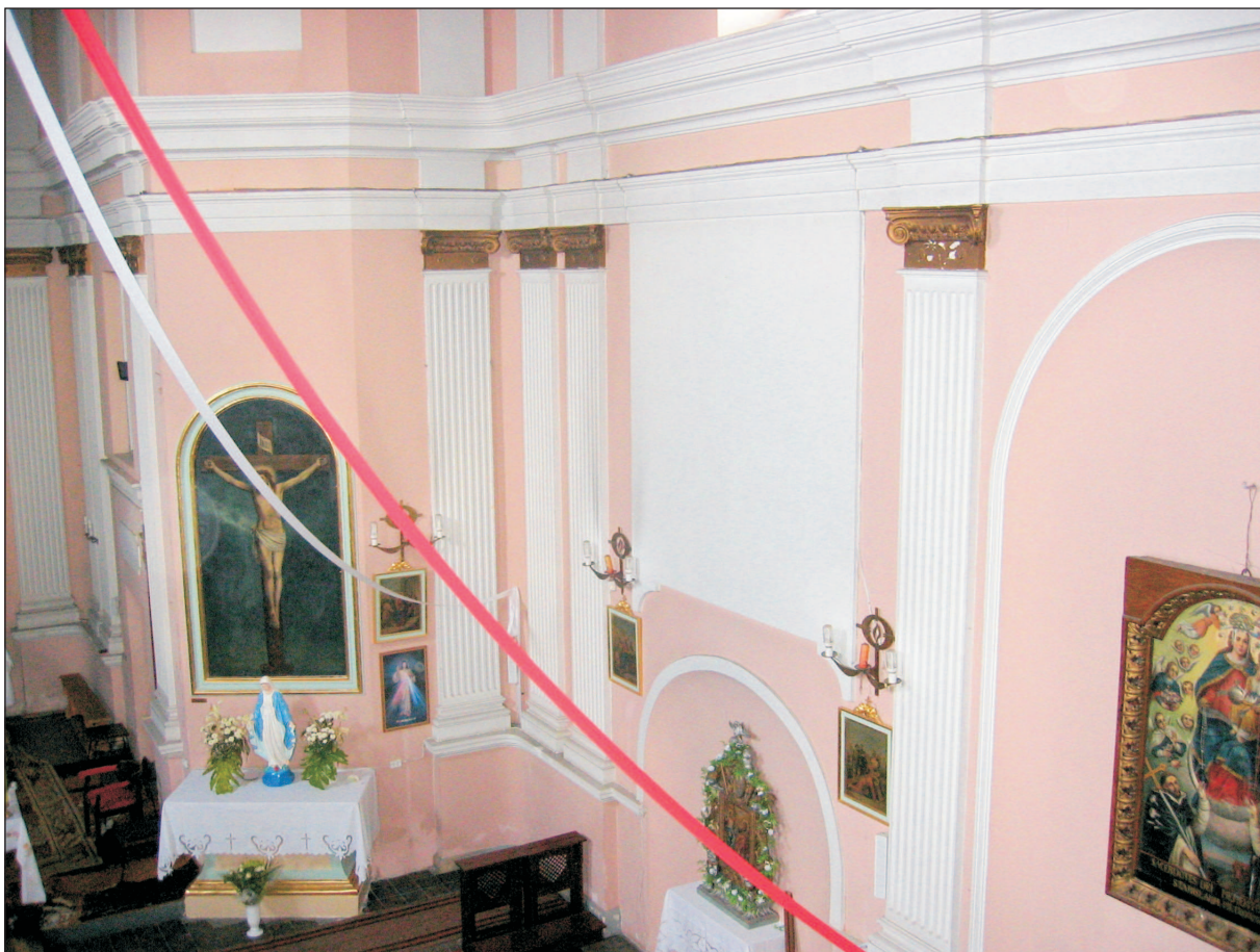
WIDOK OŁTARZA BOCZNEGO - STRONA PRAWA.