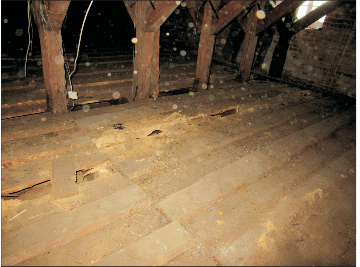
STAN PODŁOGI NA PODDASZU SKORODOWANEJ PRZEZ OWADY.