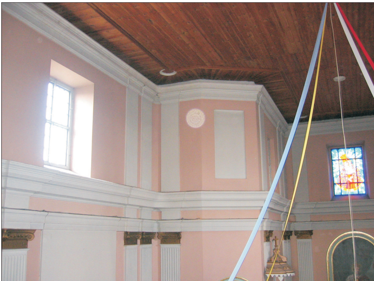
WIDOK FRAGMENTU ŚCIANY - STRONA LEWA.