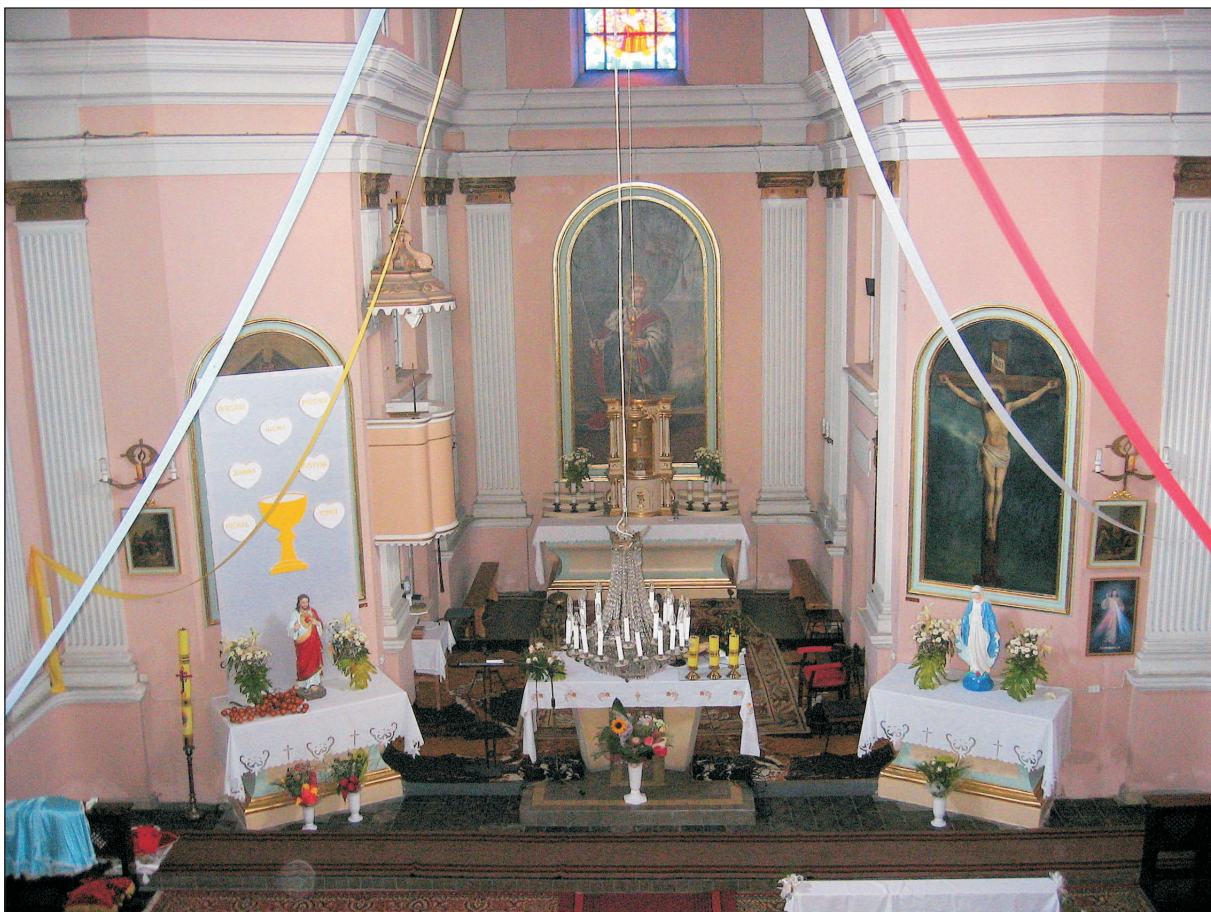
WIDOK OŁTARZA GŁÓWNEGO.