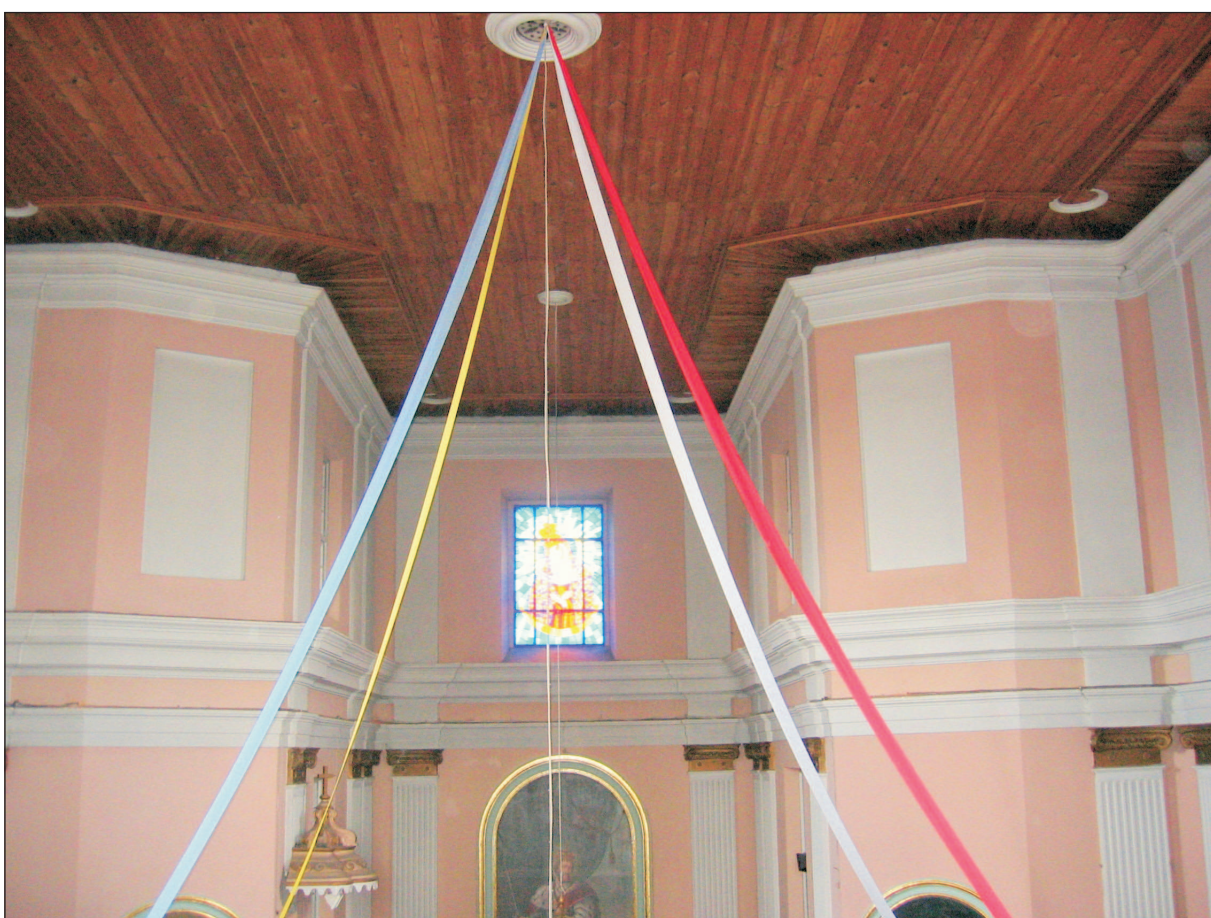
WIDOK STROPU I ŚCIAN NAD OŁTARZEM GŁÓWNYM.