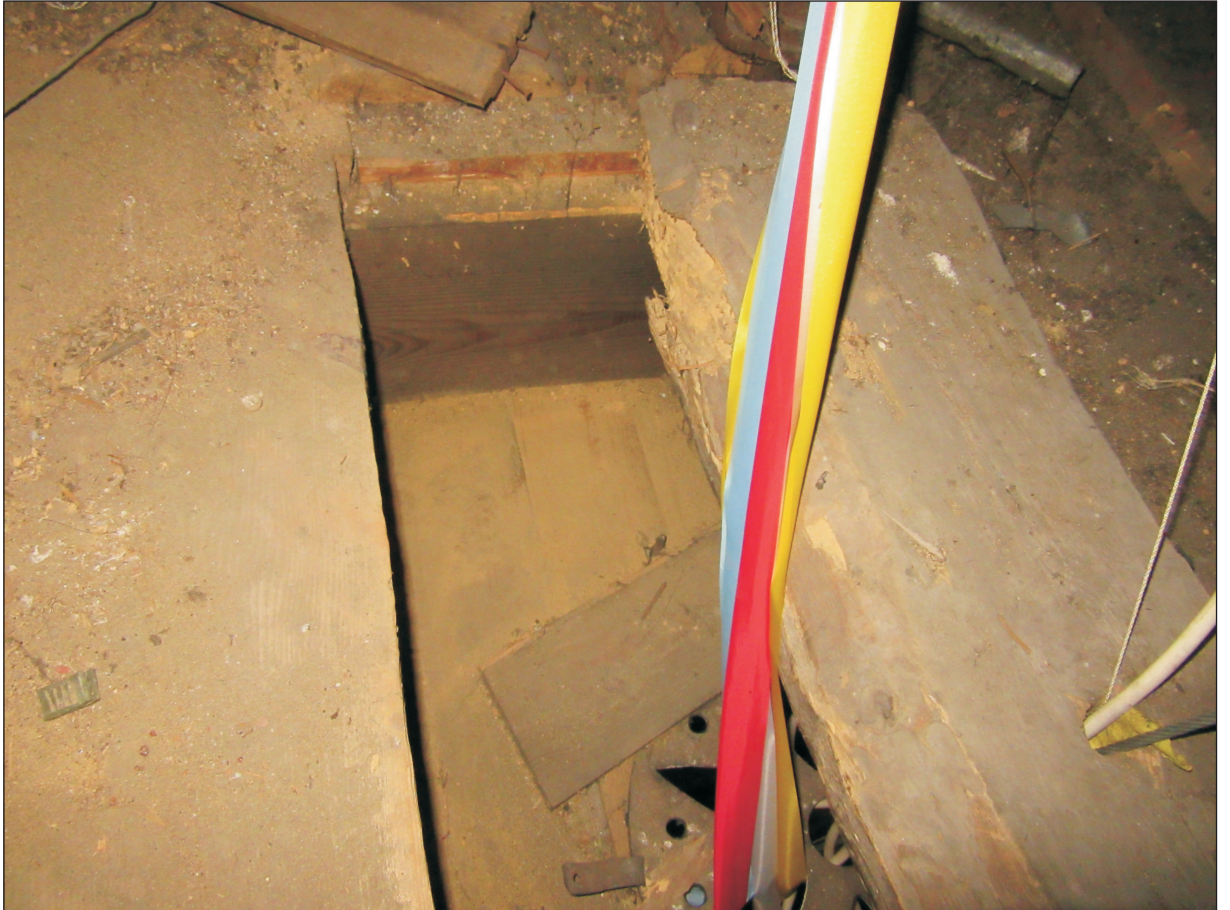
WIDOK OTWORU WENTYLACYJNEGO I PRZEKROJU STROPU NA PODDASZU.